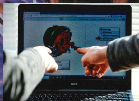
フィールドエンジニア・ 施工管理

テクノロジーの根幹を担う、半導体レイアウト設計・検証・評価など、専門生の高い技術を身に付けることができます。