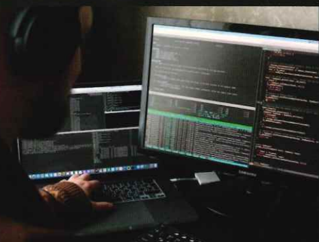
ITエンジニア・ インフラシステム開発・設計

#半導体 #IT #インフラ #設計開発 #解析 #研究開発 #ネットワーク #フィールドエンジニア #生産管理 #CAD #スペシャリスト #ゼネラリスト #ハードウェア #ソフトウェア #パワー半導体 #化合物半導体 #システム設計 #暗号化通信 #メーカー #施工管理 #環境保護 #性能検証 #組込系 #システムエンジニア #セキュリティ #ITインフラ #生活インフラ